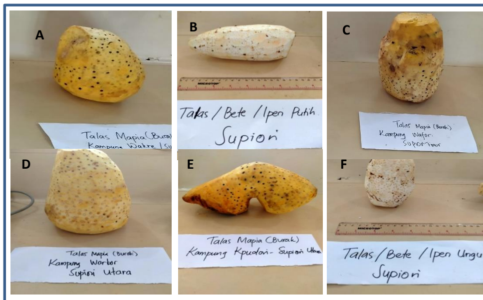
Gambar 2. Umbi Talas, (A) Genotipe WKR-TP, (B) Genotipe WKR-IP, (C) Genotipe WFR-TP, (D) Genotipe WBR-TP, (E) Genotipe KDR-TP, (F) Genotipe KDR-IU