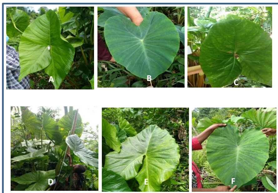
Gambar 1. Morfologi Daun Talas (A) Genotipe WKR-TP, (B) Genotipe WKR-IP, (C) Genotipe WFR-TP, (D) Genotipe WBR-TP, (E) Genotipe KDR-TP dan (F) Genotipe KDR-IU