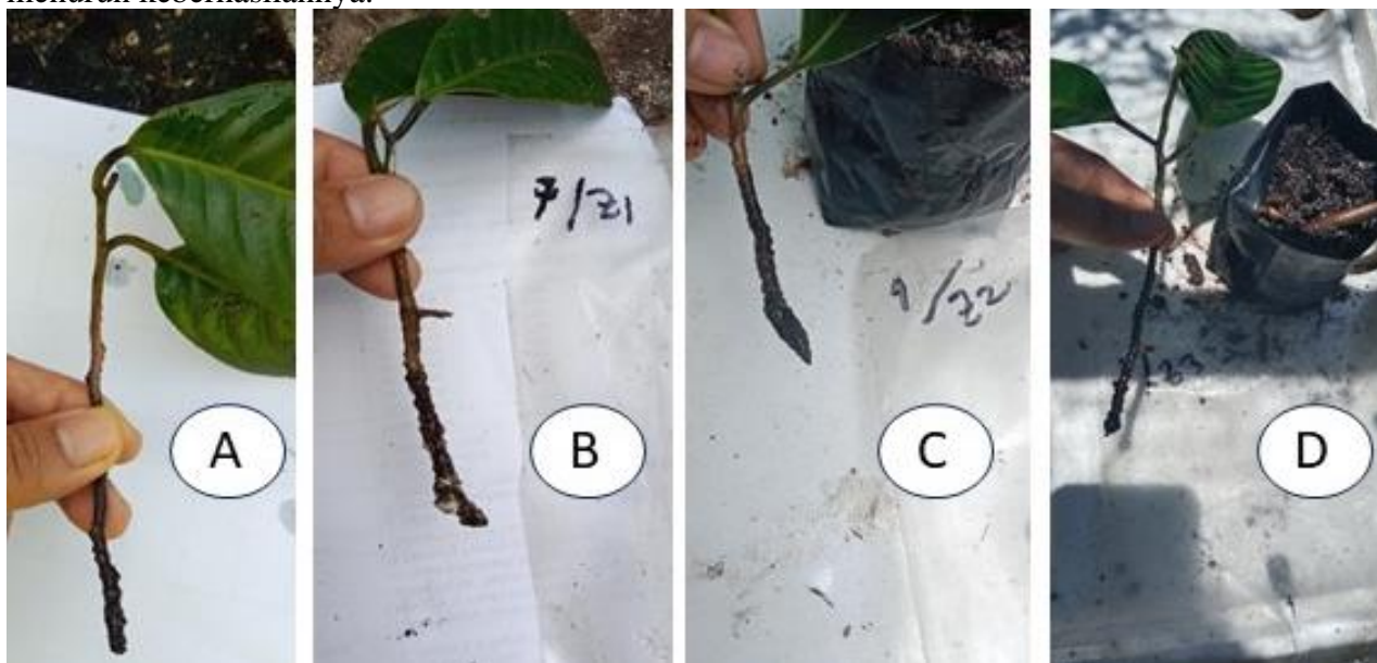
Gambar 2. Terbentuknya kalus pada stek pala Tomandin Fakfak asal tanaman dewasa yang masih hidup (a) tanpa perlakuan, (b) pemberian Rootone, (c) IBA/NAA (1000/500 ppm), (d) IBA/NAA (2000/1000 ppm)

semai, konsentrasi yang lebih tinggi cenderung menurun keberhasilannya.