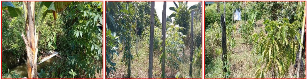
Gambar 2. Tegakan tanaman kopi bersama beragam tanaman lainnya

yang lebih beragam, sehingga dapat mengurangi ketergantungan pada satu jenis tanaman dan meminimalkan risiko gagal panen. Secara keseluruhan, praktik agroforestri ini menciptakan ekosistem pertanian yang lebih berkelanjutan dan berkontribusi pada keberhasilan budidaya kopi di daerah tersebut.