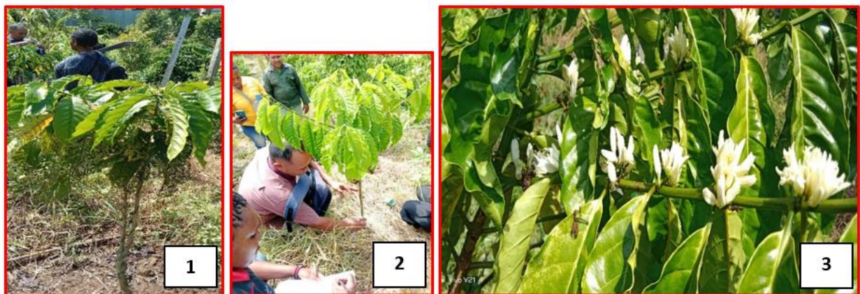
Gambar 1. Tegakan tanaman kopi (1), Pengukuran diameter kopi (2), Penampakan bunga kopi (3)

Dalam melakukan budidaya kopi, petani menerapkan sistem yang bertujuan untuk memperoleh hasil maksimal dan menghindari potensi risiko serangan hama (Schroth et al. , 2000). Sistem budidaya yang mereka gunakan adalah tanam campuran atau agroforestri. Melalui metode ini, kedua petani mengkombinasikan tanaman kopi dengan berbagai jenis tanaman lainnya, seperti pisang, ketumbar, durian, jambu biji, jambu air, papaya, matoa, kelapa, dan sukun. Hal ini sesuai dengan yang diungkapkan oleh Irbayanti dan Suparno (2022) terhadap rencana pengembangan perkebunan kopi dengan pola perkebunan rakyat dalam pola agroforestri di kabupaten Tambrauw dan Kabupaten Pegunungan Arfak. Penanaman jenis-