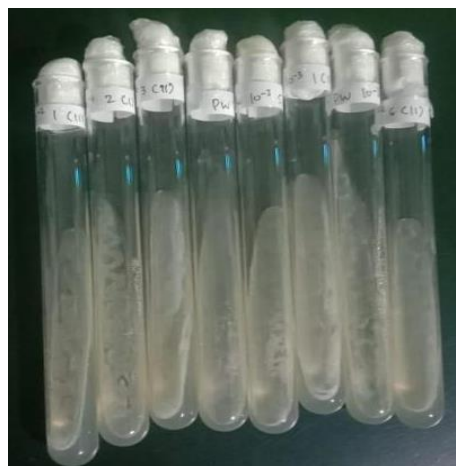
Gambar 3. Isolat bakteri dari Tailing Tambang Emas Distrik Sausapor Kampung Warmanen

Berdasarkan Tabel 1, kandungan Cu pada tailing cukup tinggi, sehingga diperlukan upaya remediasi untuk mencegah pencemaran lingkungan. Hasil uji juga menunjukkan bahwa seluruh isolat mampu mengekstraksi Cu dari tailing. Berdasarkan hasil AAS, isolat PW1, PW8, dan PW3 memiliki kemampuan ekstraksi Cu paling tinggi. Variasi kemampuan biosorpsi logam berat oleh mikroorganisme dipengaruhi oleh berbagai faktor sehingga hasil yang diperoleh antar-isolat berbeda.